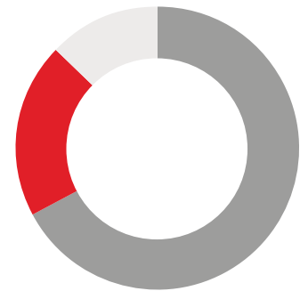
Schematische Darstellung nach Tätigkeitsfeldern der SERVIOR-Mitarbeiter